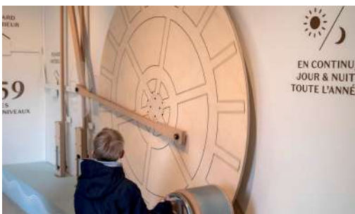
Autour des collections permanentes

10 euros par personne incluant l'entrée au musée