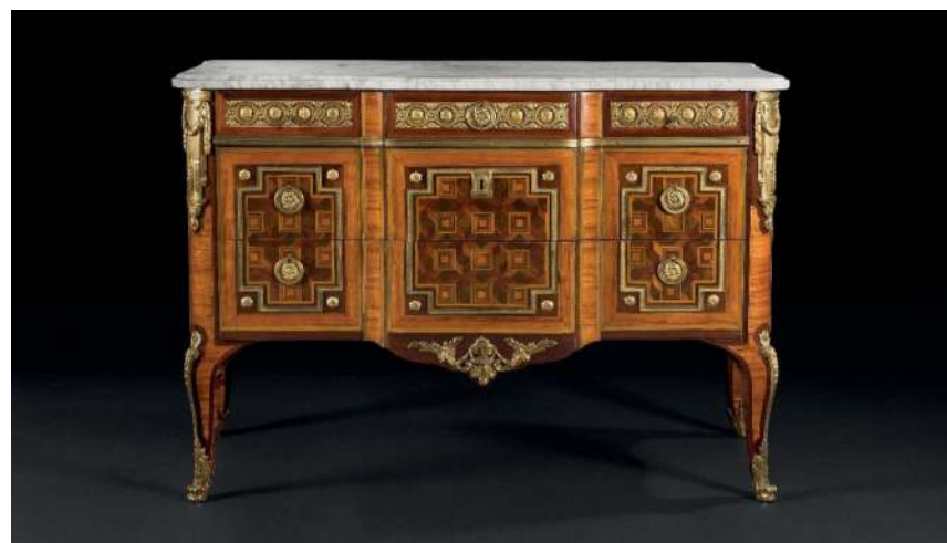
L'Œuvre de la Saison

Chaque saison, le musée met à l'honneur une œuvre de ses collections. Acquis en vente aux enchères à Drouot le 30 avril dernier, cette commode vient rejoindre son pendant déjà présent dans les collections du musée. Cette paire, attribuée à l'ébéniste Daniel de Loose, avait été livrée au château de Marly en 1771 et inventoriée en 1788 dans la chambre du comte de Provence, avant d'être dispersée lors des ventes révolutionnaires. Sa facture soignée, les éléments de son décor « Transition », entre le style Louis XV et l'émergence d'un vocabulaire néoclassique, en font un élément de compréhension de la culture de cour dans la seconde moitié du XVIII e siècle, entre art et politique, recherche de confort et démonstration à la fois d'un goût raffiné et d'un pouvoir ostentatoire.