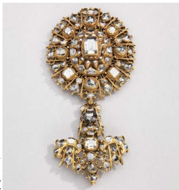
Pend à col, 18 e siècle, Ecoeu, Musée national de la Renaissance