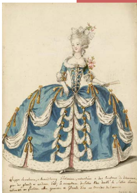
Charles-Germain de Saint-Aubin - Dessin préparatoire aux « grandes robes d'étiquette de la cour de France faisant suite au costume français », gravées en 1787 par Dupin fils, Musée des Arts Décoratifs