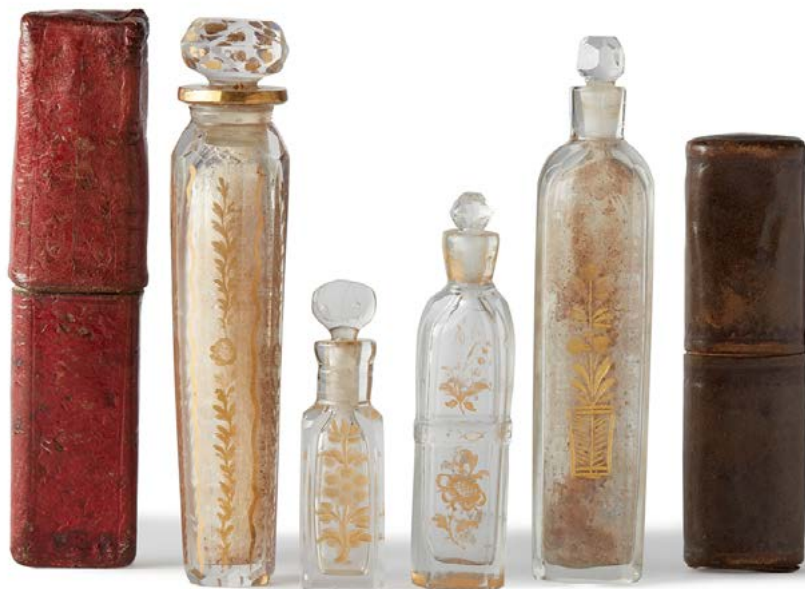
Composition de quatre flacons, 18 e siècle

Le musée du Domaine royal de Marly, rénové et réouvert en 2020, nous raconte cette histoire.