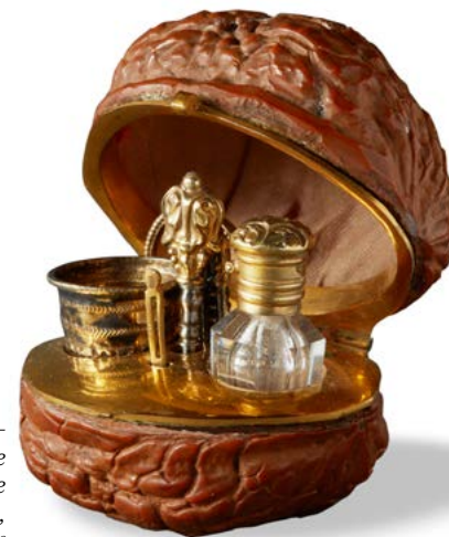
Nécessaire coquille de noix parfum, fin 18 e

Qu'elles soient rhétoriques ou esthétiques, ces armes de séduction servent l'esprit d'une société élitiste où se mêlent des enjeux amoureux, politiques et religieux.