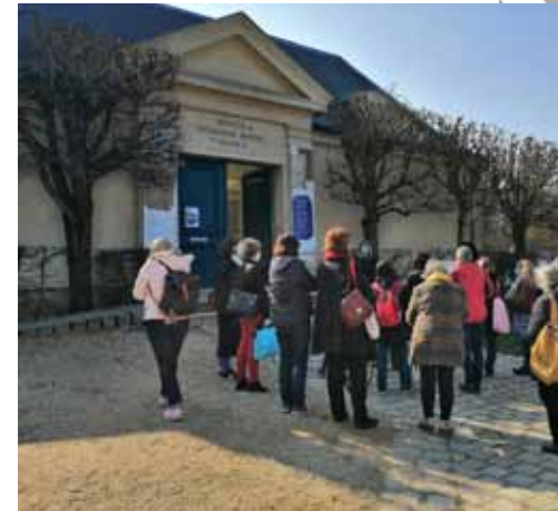
Accueil d'enseignants dans le cadre d'un stage EAC proposé par l'IEN - mars 2021

Contactez-nous et il n'est pas impossible que nous parvenions à transformer cet atelier pour qu'il convienne à vos élèves !