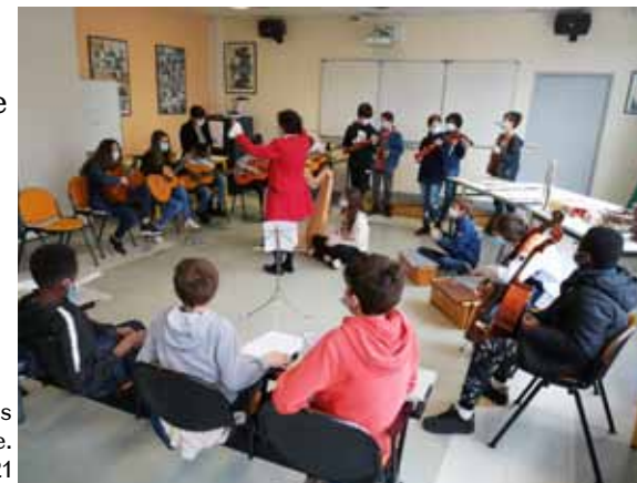
Atelier hors les murs de pratique musicale. Mars 2021