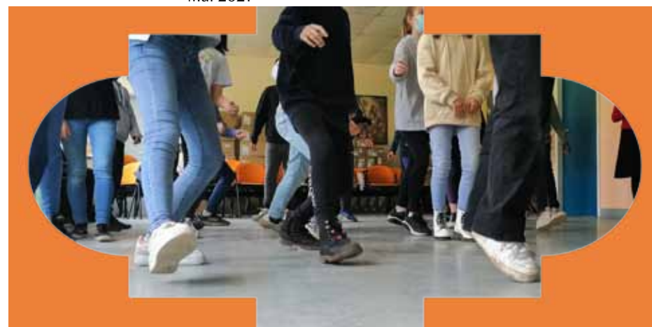
Atelier hors les murs de danse baroque Mai 2021